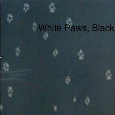
White Paws, Black Frame PFM 2531 31 B 19 $49.95

*All replacement mats are clear. The image is printed on the frame