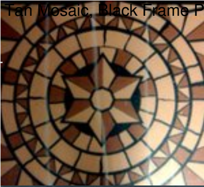
Tan Mosaic, Black Frame PFM 2531 31 B 14 $49.95